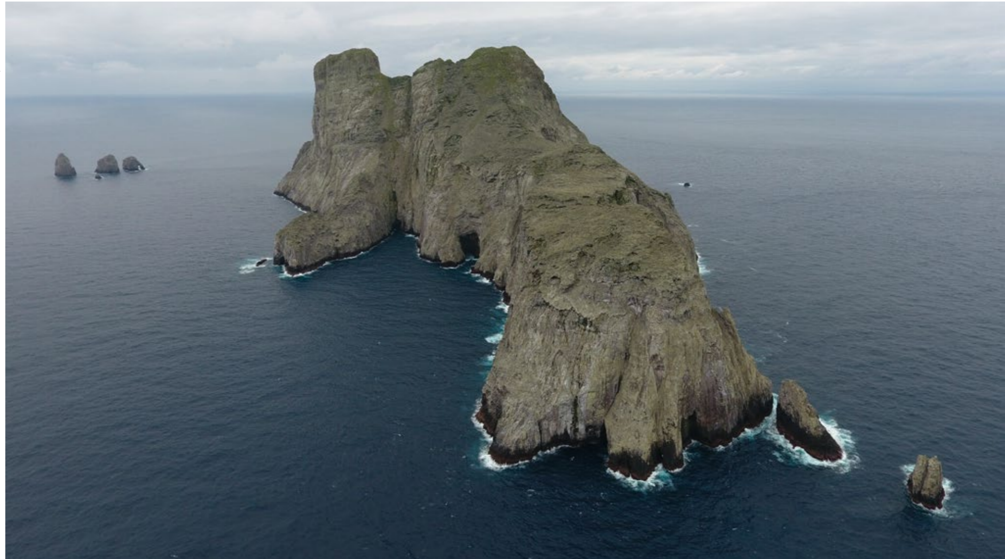
Le sanctuaire marin autour de l'île de Malpelo s'étendra désormais sur une superficie de 27 000 kilomètres carrés et permettra de protéger des zones profondes jusqu'à 4000 mètres.